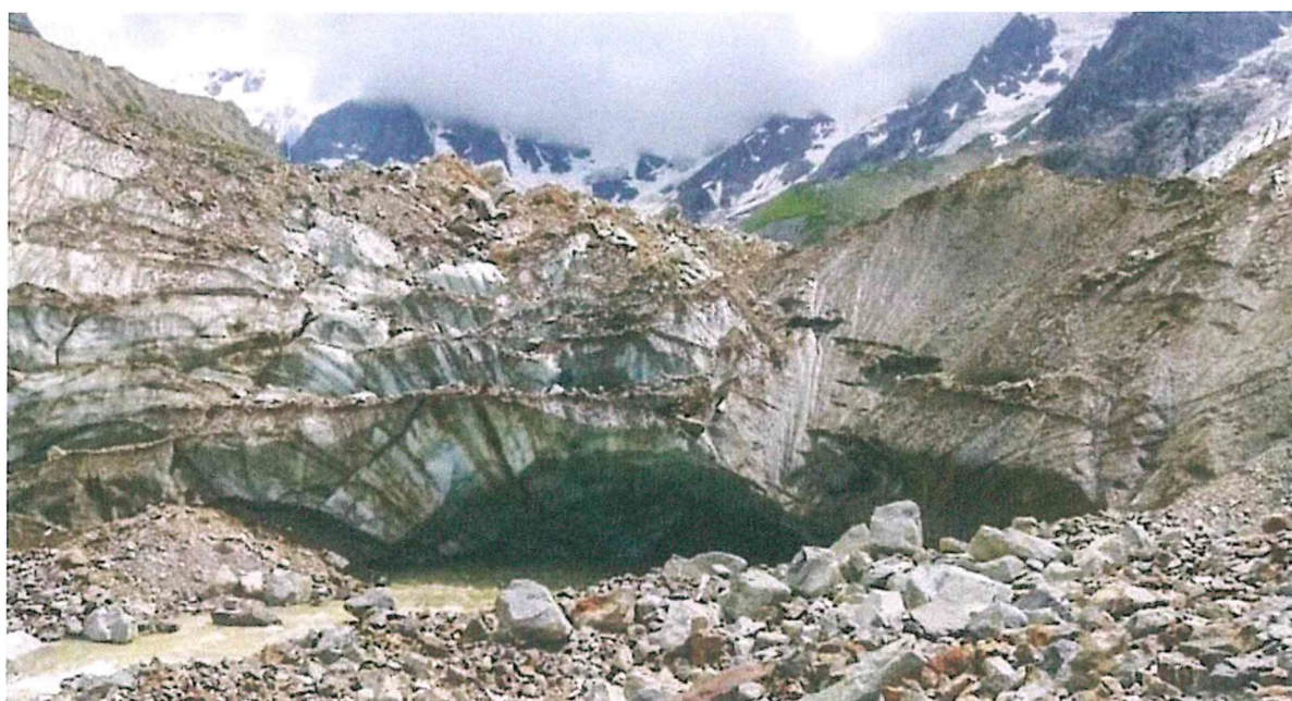
Ледник Шаурту.