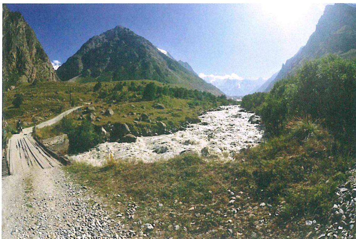
2. Мост 1.