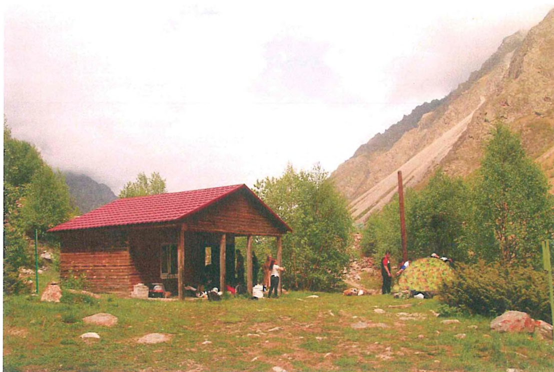
1. Место начала и окончания маршрута.