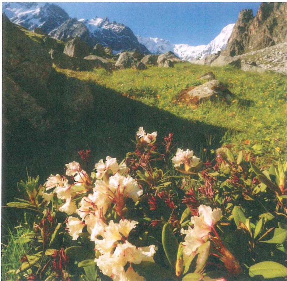
5. Рододендрон кавказский.