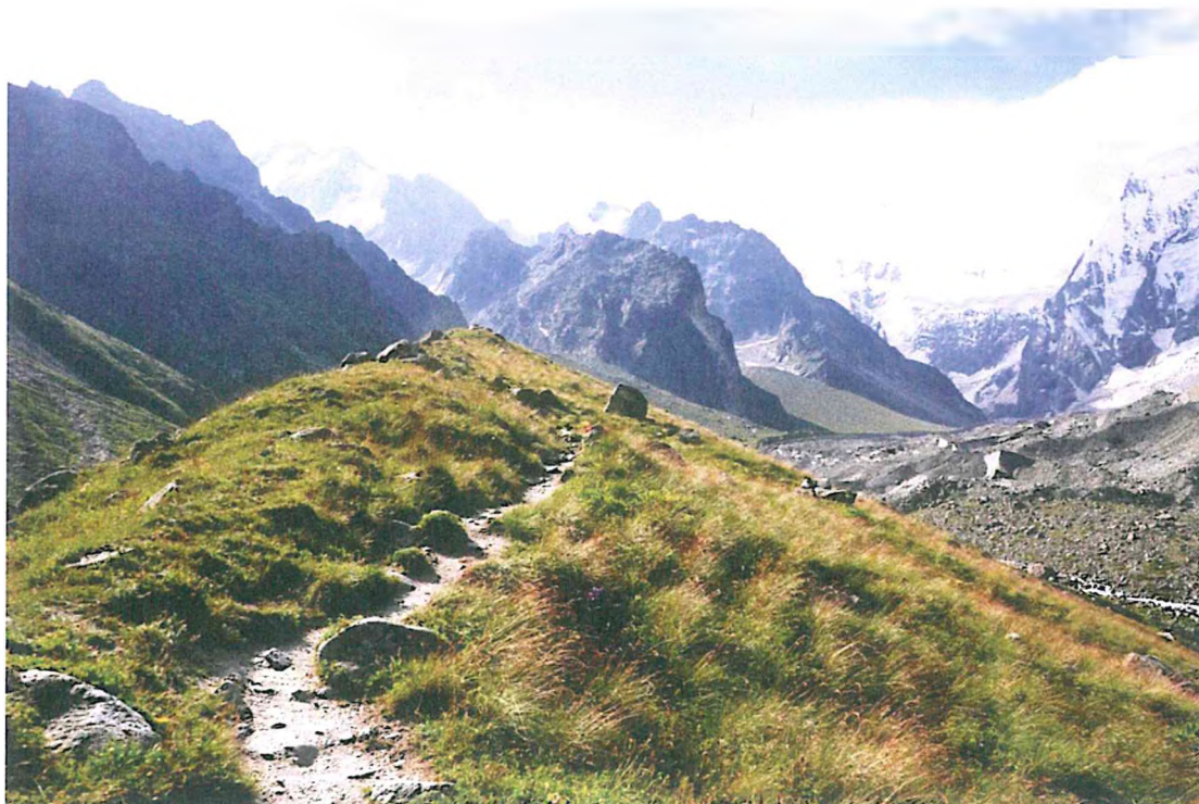
7. Подножие ледника Мижирги.