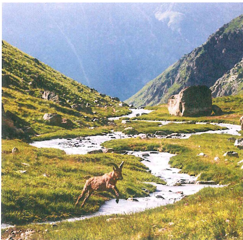
4. Река Мижирги.