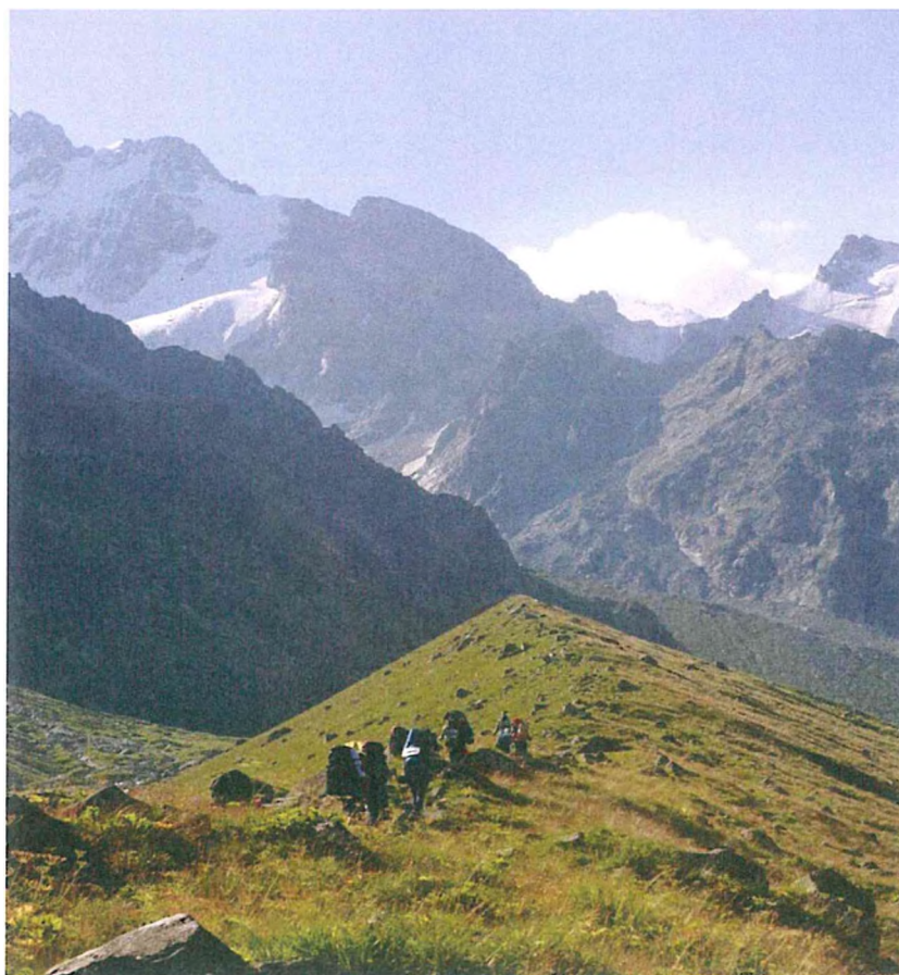
6. Движение по маршруту.