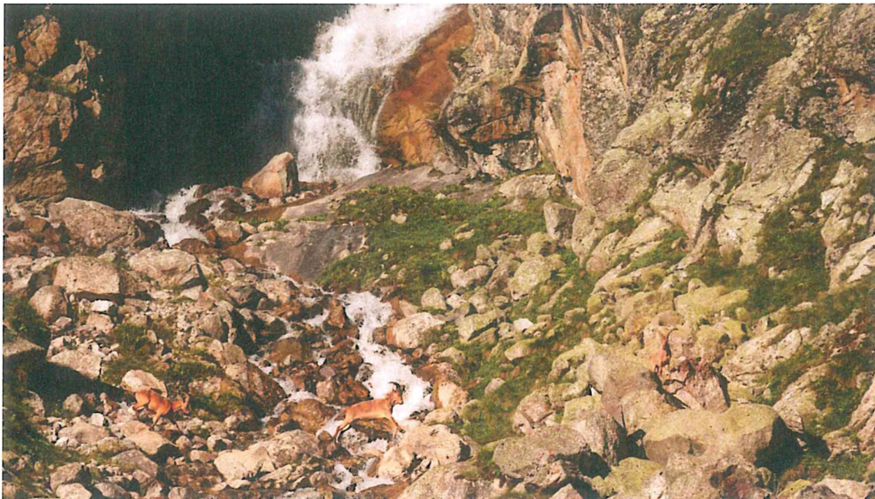
3. Кавказские туры у водопада Айгысын.